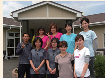
住所：四日市市朝明町 441-1 電話：(059)336-3330

私達訪問看護は現在、看護師・理学療法士・作業療法士が生後1ヶ月～97歳のご利用者を訪問させて頂いています。皆さまが「住みなれた我が家」で不安なく過ごして頂けるよう微力ではありますが、いしが在宅ケアクリニックを初め、医療機関や多職種との連携を大切に在宅医療の担い手として日々励んでおります。また、ナーシングホームもも四日市には、訪問看護以外にも居宅介護支援事業・デイサービス・ショートステイがあります。お互いに協力し、利用者や家族のニーズに応えられるようサポートさせて頂いております。今後ともよろしくお願い致します。